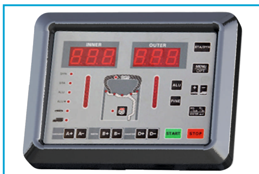
PANEL KONTROLNY NA DIODACH LED