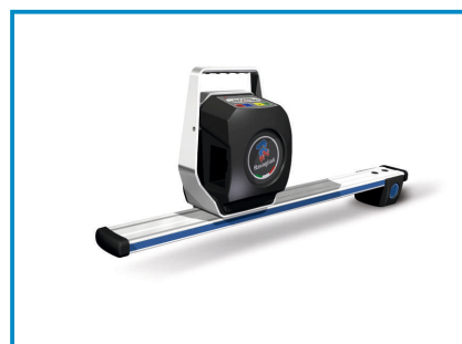
GŁOWICE POMIAROWE CCD