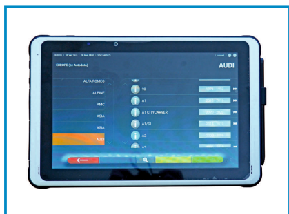
TABLET DO OBSŁUGI URZĄDZENIA

Urządzenie do szybkiego i precyzyjnego pomiaru geometrii ▪ Baza danych do pojazdów osobowych i lekkich dostawczych ▪ Pomiar realizowany w systemie technologii CCD modelowania parametrów podwozia ▪ Niezwykle szybkie oprogramowanie ▪ tablet do obsługi geometrii ▪ łączność bezprzewodowa ▪ Technologia bazująca na obrazie z 4 kamer ▪ 3 punktowe uchwyty mocujące na koła