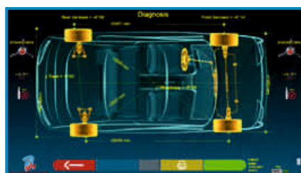
PEŁNY POMIAR CAŁEGO POJAZDU