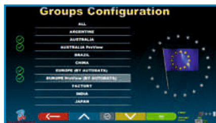
BAZA DANYCH POJAZDÓW (AUTODATA)