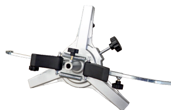
UCHWYT 3 PUNKTOWY