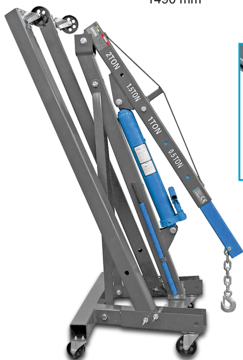
KOMPAKTOWE WYMIARY PO ZŁOŻENIU