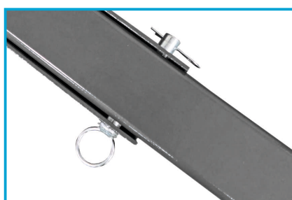
SWORZNIE TYPU SZYBKI MONTAŻ