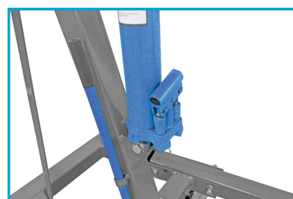
MOCNY SIŁOWNIK HYDRAULICZNY

UDŹWIG: 2000 kg MIN. WYSOKOŚĆ: 0 mm MAX. WYSOKOŚĆ: 2300 mm WAGA: 85 kg