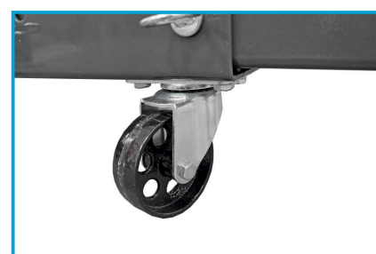
METALOWE KOŁA UŁATWIAJĄCE PRZEMIESZCZANIE