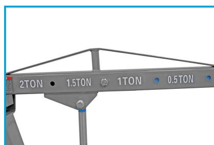
ZMIENNA DŁUGOŚĆ RAMIENIA 950 mm - 1490 mm