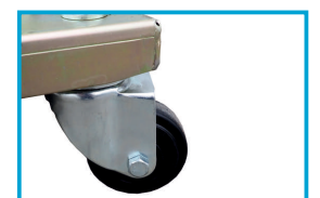
MAŁE KOŁA SKRĘTNE