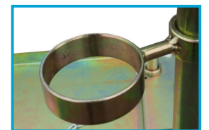
UCHWYT NA POMPE