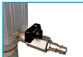
ZAWÓR WLOTU POWIETRZA

2 DUŻE PEŁNE, 2 MAŁE SKRĘTNE ŁAŃCUCH ZABEZPIECZ. BECZKĘ 200 KG