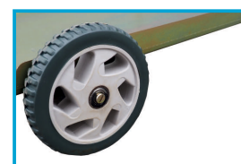
DUŻE KOŁA PEŁNE