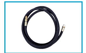
WAŻ OLEJOWY 4 M