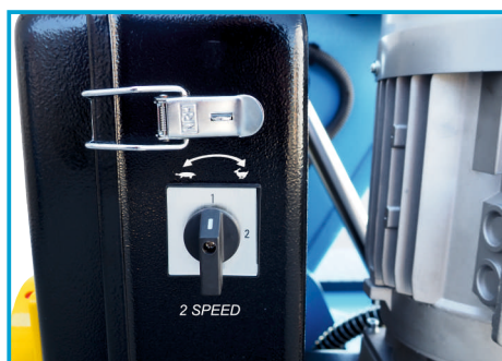
DWIE PRĘDKOŚCI OBROTOWE GŁOWICY