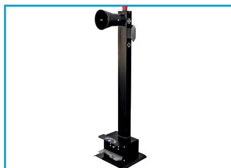
MOBILNA PRZEWODOWA JEDNOSTKA STERUJĄCA